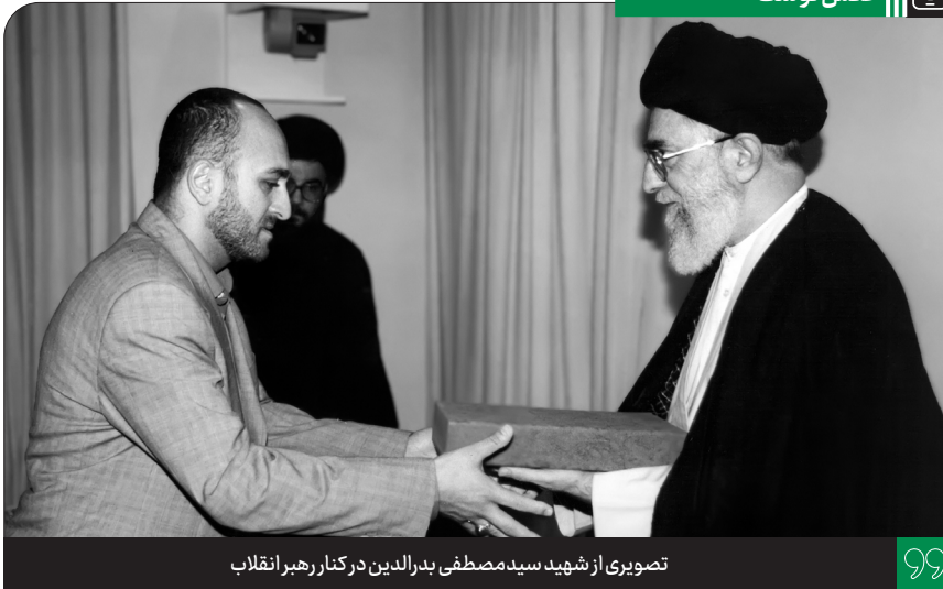
تصویری از شهید سید مصطفی بدرالدین در کنار رهبر انقلاب