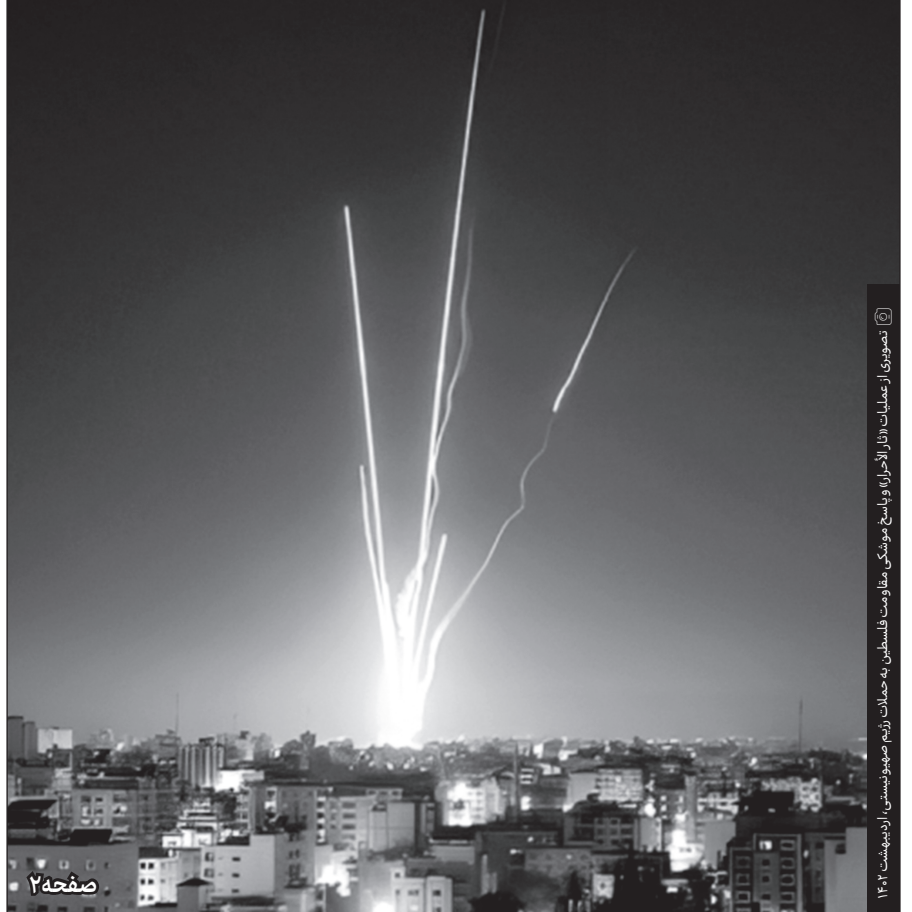
تصویری از عملیات «طوفان الاحرار» و پاسخ موشکی مقاومت فلسطین به حملات رژیم صهیونیستی (اردیبهشت ۱۴۰۲)