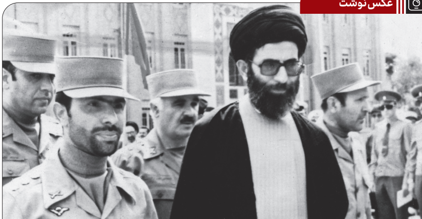
تصویری از شهید صیاد شیرازی در کنار آیت الله خامنه‌ای